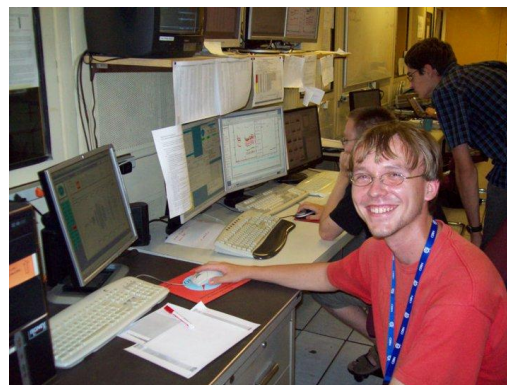
Pavel Motal v CERNu

Nikl jako alergen a jeho spektrofotometrické stanovení (jeden z úspěšných studentských projektů), Jak vystopovat uprchlou radioaktivitu (metody radiometrie), Led (a vysvětlení jeho vlastností), Temná hmota a experiment OSQUAR (o zapojení českého studenta do projektu hledání nových elementárních částic v CERN), Grafen, Elektřina ze sluneční elektrárny ve dne v noci, či Patero tipů, jak na dovolenou bez vybitých baterií.