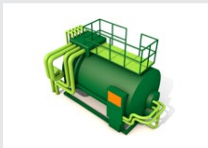
Zařízení pro tepelnou energetiku