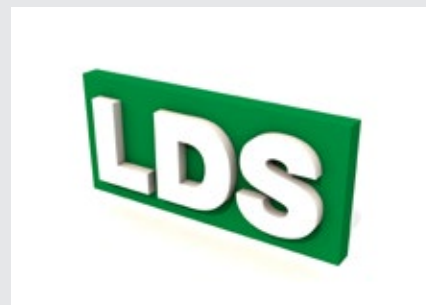
Lokální distribuční soustava

Kompletní nabídka řešení na www.cezesco.cz